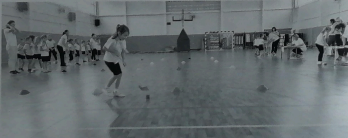
Вперёд к победе

Начиналось все очень робко. На начальном этапе и педагоги, и родители «стеснительно» выполняли задания, как будто были не совсем уверены в своих силах, боялись проявить себя. Но внутренний страх быстро исчез, ведь соревновательный дух является неким стимулом движения вперед. Участники мероприятия в эстафетах отгадывали загадки от «картошки», собирали урожайный