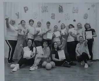
А ну-ка девушки, А ну, красавицы!

Поучаствовав в спортивно-интеллектуальных играх, родители стали активными членами нашего взросло-детского сообщества, проявляющими интерес к новому приоритетному направлению работы детского сада по сотрудничеству с семьей. Объединяющим стало понимание папами и мамами того, что ребенка можно и нужно развивать в непринужденной обстановке, что любимая активность детей – двигательная, а игра – основной вид деятельности для дошкольников. Когда педагоги и родители вместе, когда дети это видят и радуются, то гарантировано развитие личности ребенка и воспитание самых лучших его качеств.